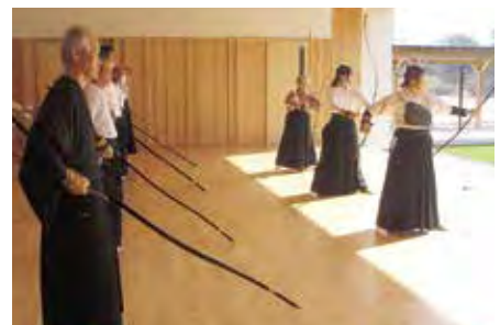
弓道部 一点を見つめて