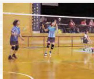
県民スポーツ大会 バドミントン競技