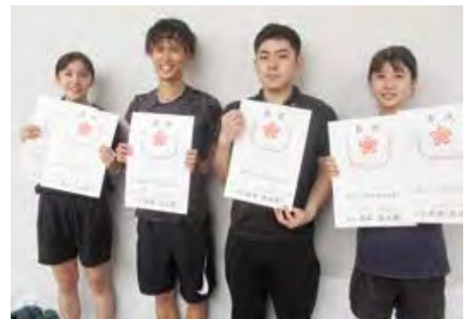
陸上競技 多くの賞状を手にして!!

4月に建築された新しい飯塚総合体育館での開会式、大会には役員選手団44名が出場しました。