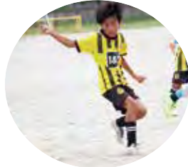
※写真は昨年の大会より