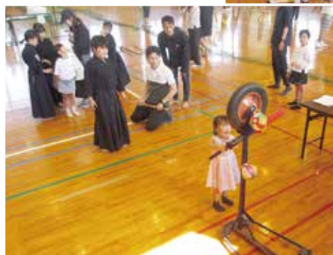
面・胴・小手 紙風船われたかな～