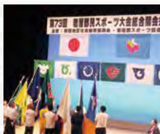
郡民スポーツ大会開会式