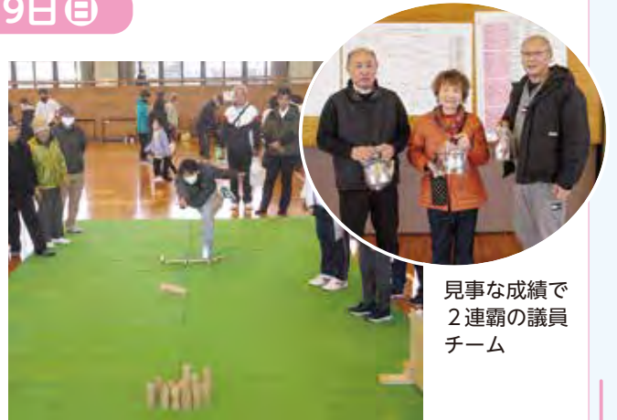
見事な成績で 2連覇の議員 チーム