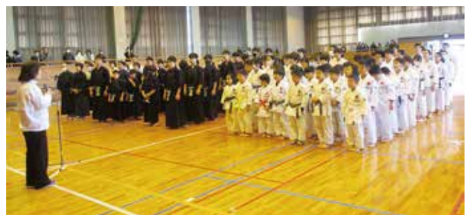
開会式 3協会揃って

古武道の精神のもと凛としたたたずまいで開会式が行われました。剣道部・空手協会・弓道部より200名の選手が参加しました。来賓や師範多くの応援に子供たちの元気な声が響きました。又、新設された弓道場では静寂の中、的に向かって矢を射抜く姿に魅了されました。