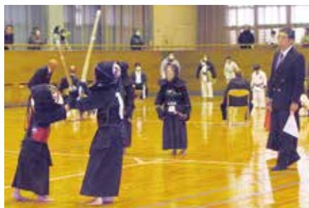
剣道部 新人の部の試合