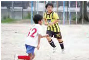
見事な足さばき“ゴール”

自主性・技術・体力の向上を図り感謝の気持ちを表現し仲間との絆を大切にチームリーダーとしての雄姿はとても素晴らしかったです。