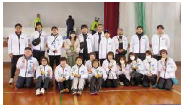
笑顔で!! 全員景品をゲット