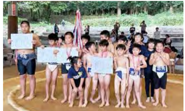
優勝旗・多くの賞状 誇しい笑顔

相撲協会の尽力で稽古に励み大会に参加しました。日頃の練習の成果で団体優勝、学年別の個人戦においても優勝という素晴らしい活躍でした。