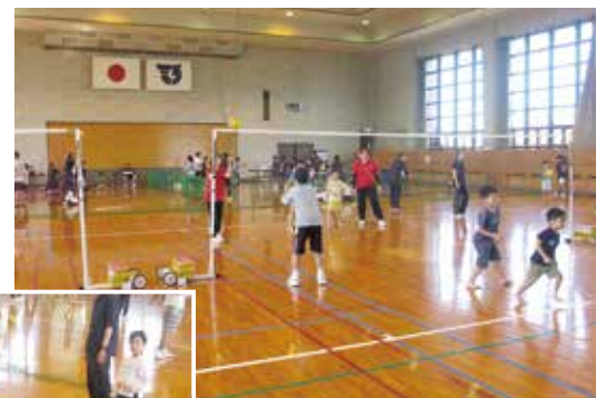
バドミントンネットでのバレーボールゲーム