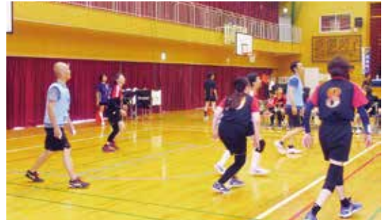
バレーボール競技 マスターズ“優勝”