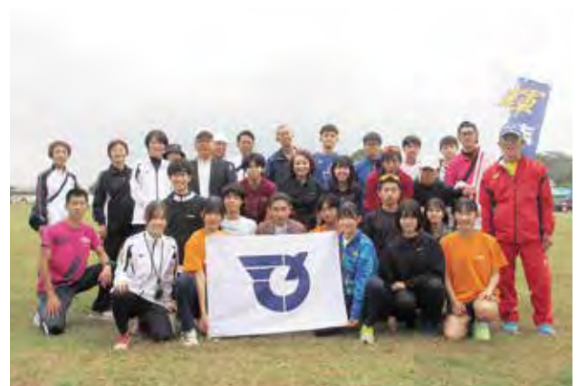
多くの応援団の声援を受けて!!