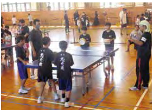
お風呂の桶を使って!! できたかな～

ミニミニ運動会・モルック大会・スポーツ体験コーナー・キッズアスレチック・軽スポーツ体験等が行われました。スポーツ協会体験コーナーには剣道・卓球・バレー・ミニバレー協会が趣向こらした取り組みを考案して参加者を楽しませました。