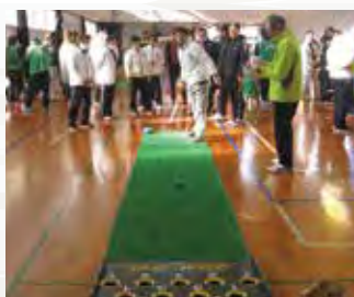
スポーツフェスティバル スカットゴルフ