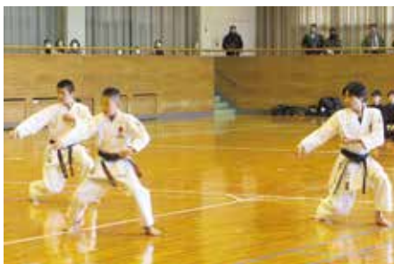
空手協会 小学生による演武