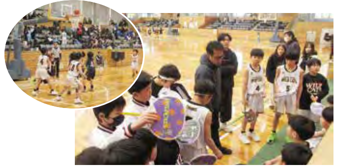
ハーフタイム “コーチの助言を受けて”

試合を通して競い合い、友情を育み、友達の輪を広げる目的で開催しました。ミニバスケット16チーム400名の参加でした。各順位別表彰及び、各チーム1名に優秀選手賞が授与されました。