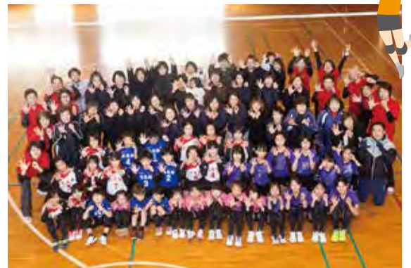
会員で50ポーズで～す